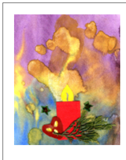
Collage aus Buntpapier, Zweig und Goldsternen