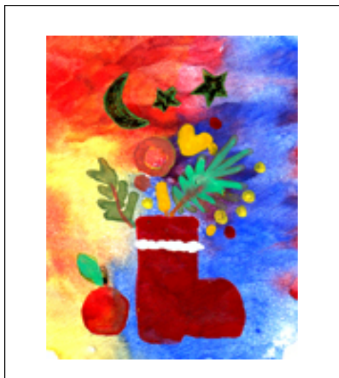
Das Motiv wurde mit dickflüssig angemischter Aquarellfarbe gemalt, Mond und Sterne sind aus Goldpapier