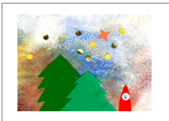
← Collage aus Buntpapier und ausgestanzten goldenen und gelben Punkten