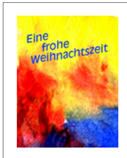
Karte mit Weihnachtsgrüßen